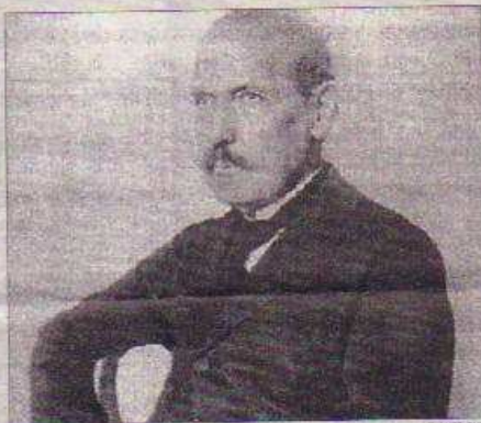
Imatge del compositor del fons gràfic de la Biblioteca Valenciana.

El llibre desenvolupa la seua vida per èpoques, en les quals es «va narrar la seua producció musical més important, les crítiques a